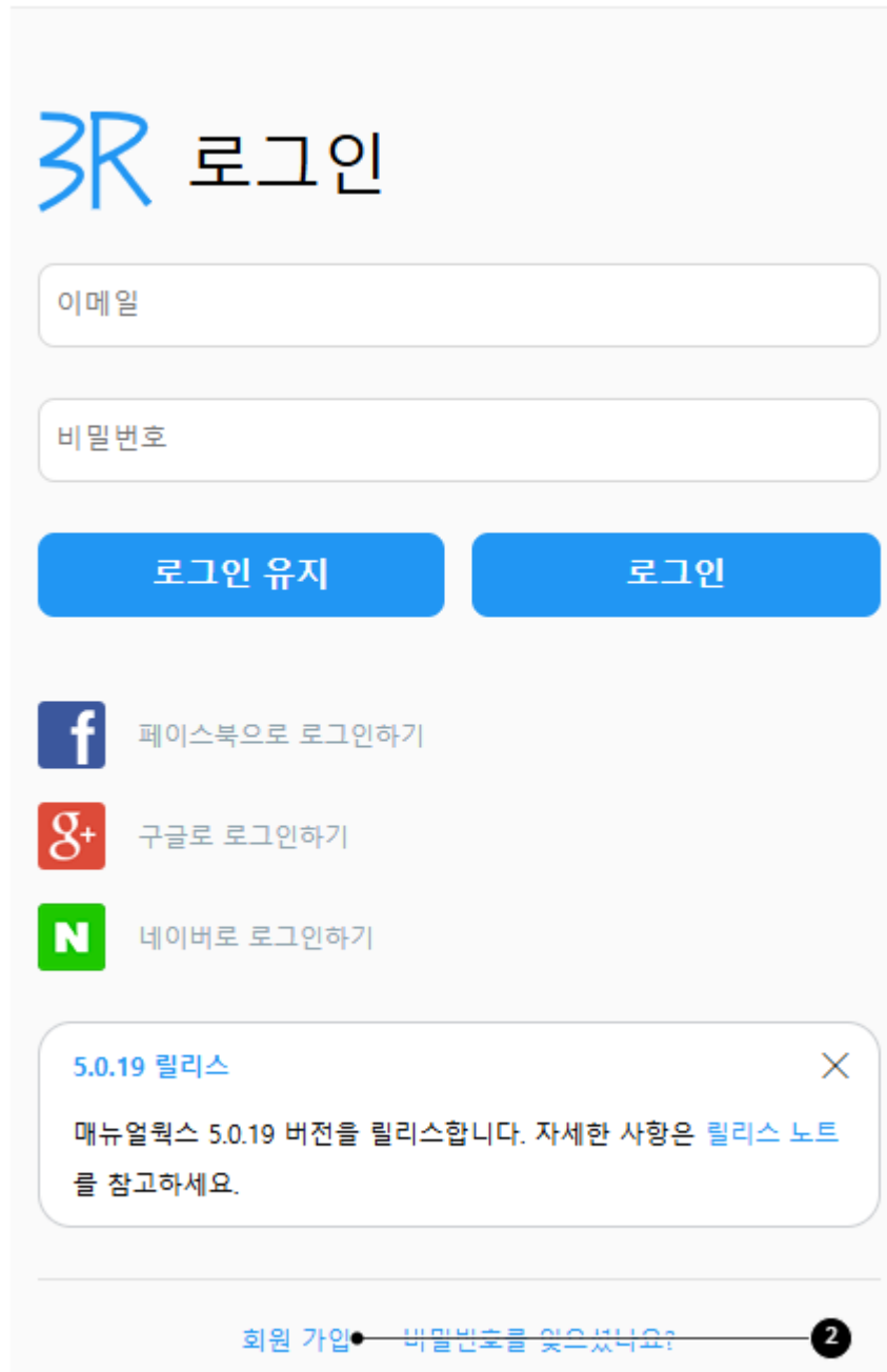
그림 5-2 회원 가입 링크